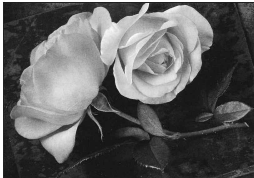
La rosa, il fiore che esprime l'amore e ispira i poeti.

Al Museo Bergomi sono in programma serate con proiezione di film tratti da altrettanti romanzi del Novecento. I film ancora in programma sono: domenica 20 novembre IL GENERALE DELLA ROVERE (da un racconto di Indro Montanelli) - domenica 27 novembre IL GIARDINO DEI FINZI CONTINI (romanzo di Giorgio Bassani) - domenica 4 dicembre CRISTO SI E' FERMATO A EBOLI (dal romanzo di Carlo Levi).