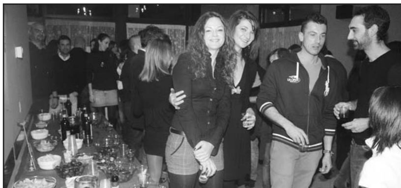
Bella gioventù alla castagnata.

Soddisfatta la direzione che vede premiata la fantasia nel creare eventi che coinvolgono, nel modo e nei tempi giusti, una clientela che sembra apprezzare questo modo di proporsi da un bar-piadineria che offre anche la possibilità di degustare birre di qualità. Alla prossima.