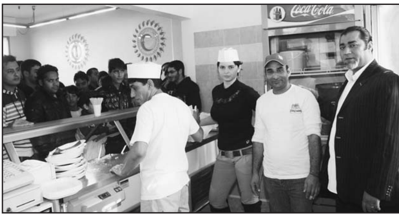
I promotori dell'iniziativa.

Trattasi infatti dell'apertura di un nuovo punto vendita legato ad una catena di ristoranti PAKINDIANI che sono la caratteristica delle zone di origine dei titolari. L'esperienza maturata in ben 12 anni di presenza in Italia ha visto la crescita di questa organizzazione che opera anche nel bergamasco. Una