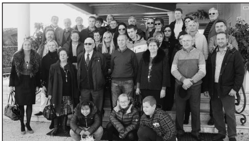
Foto ricordo sulla scalinata dell'agriturismo Sosta Napoleonica.