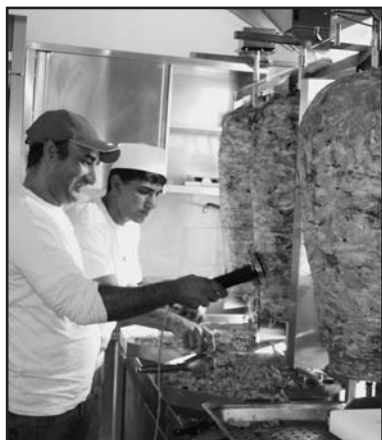
La classica lavorazione.

Il nuovo ristoro si trova a Montichiari, in via Trieste 76 tel. 338 4058649.