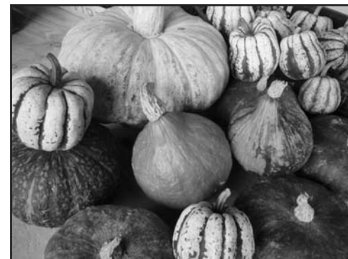
Prodotti della nostra terra.

venerdì 13 gennaio: L'inverno venerdì 30 marzo: La primavera