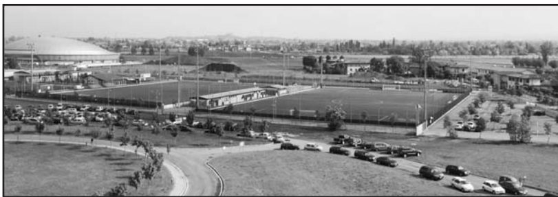
Il complesso sportivo Montichiarello con a fianco l'area destinata al nuovo Romeo Menti.

A distanza di 12 anni cosa è cambiato? Nulla. Gli spettatori sono gli stessi così come la categoria C2. Forse soltanto la nuova proprietà della società calcistica monteclarense, un imprenditore edile della Calabria? Per tutta estate il presidente dimissionario Soloni